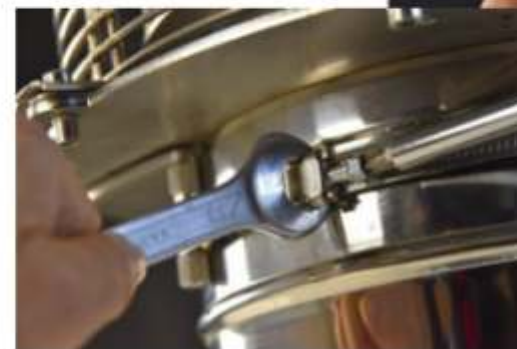
7° Particolare blocco fascetta