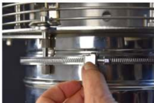
5° Posizionamento blocco fascetta