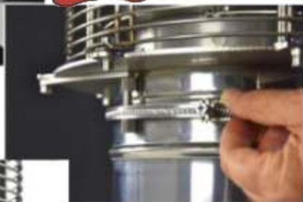
3° Bloccaggio fascetta