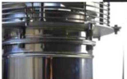
4° Bloccaggio cilindretti