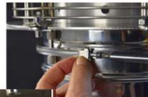
6° Fissaggio fascetta