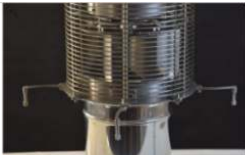
1° Aprire i braccetti