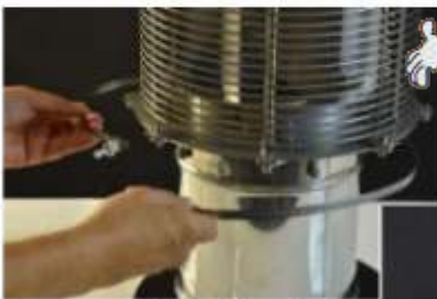
2° Posizionamento fascetta