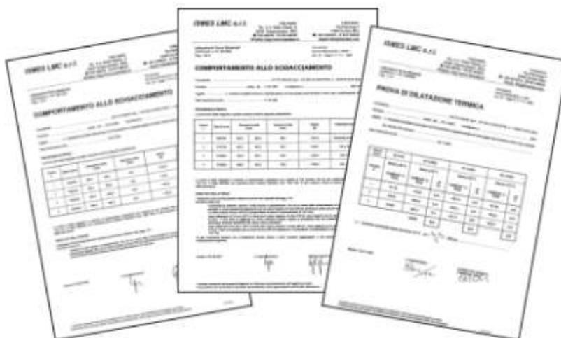
Certificati resistenza alla compressione. Certificato dilatazione termica.