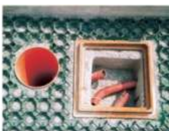
Particolare della posa di tubi e pozzetti.