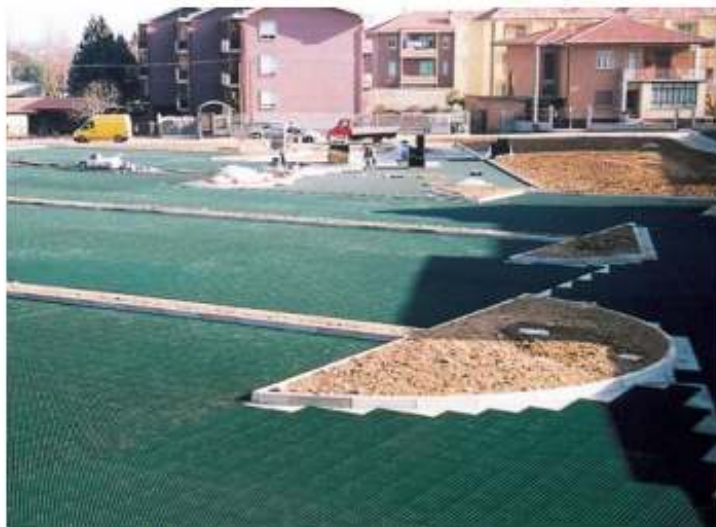
Posa del grigliato in prossimità dei cordoli.