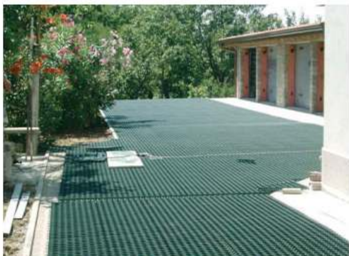
parcheggio ad uso privato.