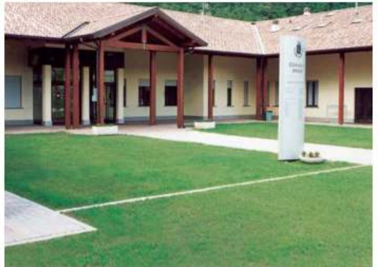
area pedonale e carrabile prima e dopo la crescita dell'erba.