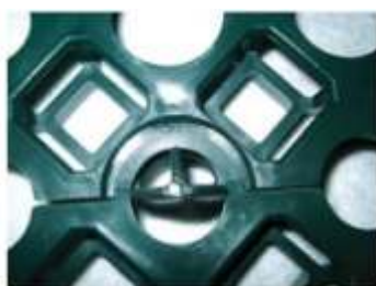
Punto di giunzione e fissaggio tra lastre.

Prima di procedere alla semina si consiglia di irrigare abbondantemente a pioggia la pavimentazione. Terminata la fase di semina è opportuno procedere ad un'adeguata concimazione e a frequenti irrigazioni fino alla formazione completa del tappeto erboso. In presenza della giusta umidità, il terriccio di riempimento degli alveoli si abbassa di circa 1-1,5 cm lasciando all'erba lo spazio per svilupparsi, senza essere danneggiata dal transito.